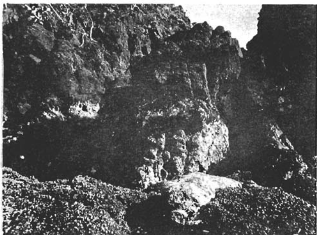
Figura 3.- Fotografía de la bahía frente al Km 46 de la carretera Playa Azul-Caleta de Campos, que muestra en la parte inferior a la colonia de corales y hacia la porción media el horizonte D, constituido por balanos y algas coralinas costrosas.

En una pequeña bahía frente al Km 46 de la carretera Playa Azul-Caleta de Campos (Figuras 2, 3 y 4), se observó un arrecife del coral Pocillopora elegans (horizonte A) con la cima emergida a 0.40 m aproximadamente del nivel del agua en el momento de la observación (0.65 m del plano de referencia). En la parte inferior de la colonia que permanecía bajo el agua, los polipos se encontraban aun vivos, en contraste con la parte superior (Figura 4), que estaba expuesta a la intemperie, y cubierta por una costra verdosa compuesta por los polipos recientemente muertos, lo cual apoya la hipótesis de un levantamiento reciente. A 0.23 m la cima de la colonia de corales (0.90 m sobre el plano de referencia), se observó una zona de algas enteromorfas (horizonte C) desecadas sobre los escarpes rocosos. Por último, a los 0.54 m de la cima de la colonia de corales (1.20 m sobre el plano de referencia), se ubicó el horizonte blanco de balanos y algas coralinas costrosas muertos (horizonte D), como se muestra en la Figura 3. Realizando las operaciones correspondientes, se calculó un levantamiento del orden de 0.60 m para esta localidad.