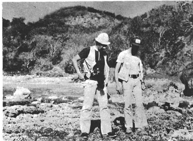
Figura 4.- Misma bahía que en la figura anterior, mostrando al arrecife de corales emergido como resultado del levantamiento asociado al sismo.

En la parte rocosa de esta bahía se encontró, desde el nivel de la marea hasta los 0.17 m de altura, algas enteromorfas vivas, probablemente desarrolladas durante los dos meses posteriores al sismo; también se encontró una zona con una población muy densa de Chama sp. de los 0.18 m hasta aproximadamente 0.68 m del nivel de la marea; estos bivalvos murieron recientemente, quedando aun vivos solo aquellos que están adheridos a grietas u oquedades bajo la sombra. Entre los 0.72 y los 0.80 m sobre el nivel de marea, se ubicó al horizonte D correspondiente a los balanos y algas coralinas costrosas. El levantamiento calculado para este lugar es de 0.45 m.